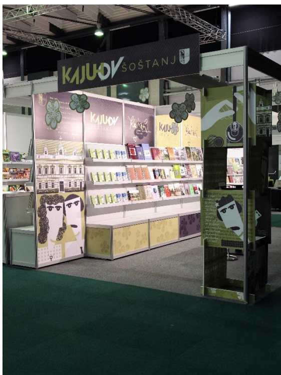
Stojnica Kajuhov Šoštanj.

Osrednji poudarek naših predstavitev je bila knjižica Sto dejstev o Kajuhu . Publikacijo je izdala Občina Šoštanj decembra 2022 – ob 100. obletnici pesnikovega rojstva , ko smo praznovali Kajuhovo leto v občini Šoštanj. Letos, ko praznujemo Kajuhovo leto na državni