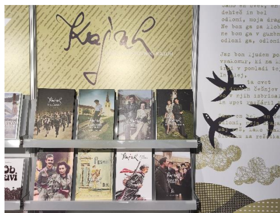
Zbirka osmih knjig Kajuh 100.

Kajuhov Šoštanj je na stojnici Slovenskega knjižnega sejma predstavljal tudi druge knjige o pesniku Kajuhu, ki so izšle pri različnih založbah in s podporo Občine Šoštanj. Vodilna je zbirka