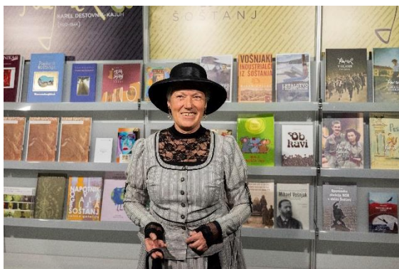
Kajuhovci na stojnici Kajuhovega Šoštanja, mesta v gosteh.